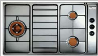
▲开关钮在右边, 自备点火器点燃

Rhoixon 乐声牌意大利煤气炉 , 与众不同, 采用 不锈钢炉头盖, 绝不生锈 。众所皆知在铜铁铝材料上钻孔是轻而易举的事, 不锈钢材料就不那么容易钻孔, 金属硬度肯定比一般的铜铁铝都略胜一筹。