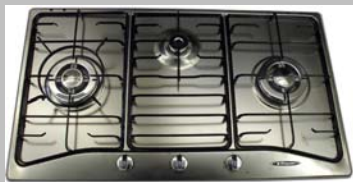
▲开关钮在前方, 电池自动点火点燃

您对产品有多深入? 才是关键所在, 有如产品的原产地, 功能以及保养等等, 还有将来更换时, 已经定型的洞口, 能否轻易的找到同样尺寸的煤气炉来替换。